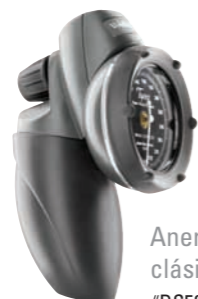
Aneroid de mano clásico DS58 Tycos® #DS58-11