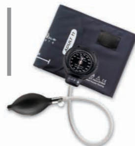
Aneroid integrado clásico DS48A Tycos® #DS48A-11

GARANTÍA DE CALIBRACIÓN DE 15 AÑOS • RESISTENCIA A IMPACTOS DESDE 76 CM • GARANTÍA DE CALIBRACIÓN DE 15 AÑOS • RESISTENCIA A IMPACTOS DESDE 76 CM