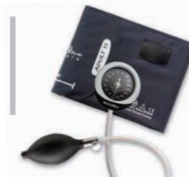
Aneroid integrado DS45 #DS45-11

GARANTÍA DE CALIBRACIÓN DE 5 AÑOS • RESISTENCIA A IMPACTOS DESDE 76 CM • GARANTÍA DE CALIBRACIÓN DE 5 AÑOS • RESISTENCIA A IMPACTOS DESDE 76 CM