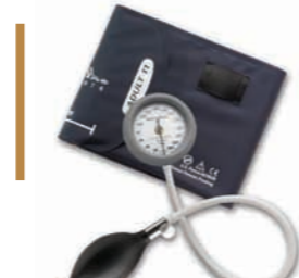
Aneroid integrado DS44 #DS44-11